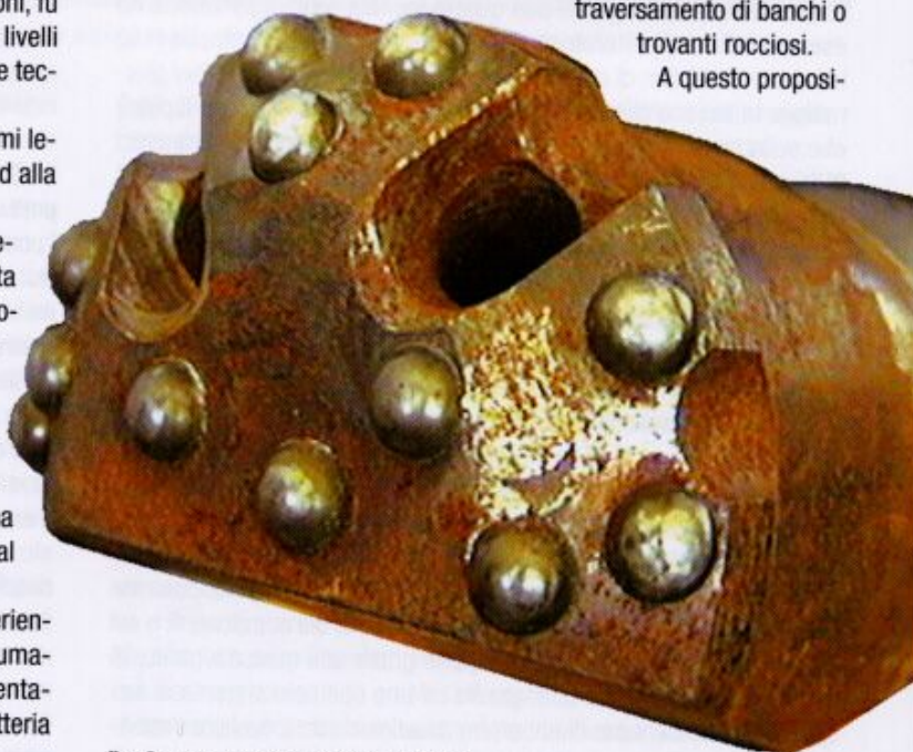
fig. 2 - una punta da roccia per DDD.