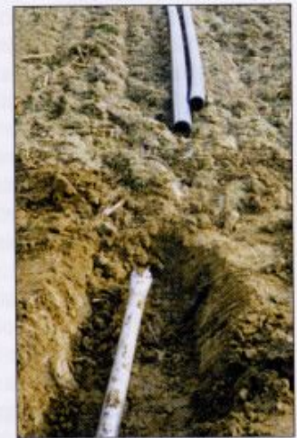
fig. 6 - Repubblica Ceca, febbraio 1999 - posa di un acquedotto in PEAD DN300 per una lunghezza di tiro pari a 160 m: a) buca di arrivo, in basso si nota la punta di perforazione da DDD in emersione; b) un momento del tiro della condotta nel foro - (per gentile concessione della SE S.r.l. - Italia).

Nella ricerca d'acqua, infine, con tecnica di DDD è possibile realizzare opere di presa a captazione orizzontale, di maggiore efficacia rispetto ai tradizionali pozzi verticali, così come è già avvenuto nel settore petrolifero, senza però rischiare di inquinare la falda con fanghi bentonitici.