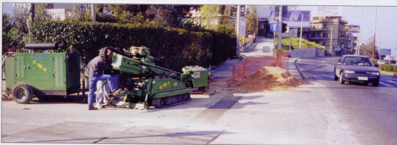
fig. 4 - Atene (Grecia) - Febbraio 1999 - Attraversamento stradale in zona urbana mediante DDD - (per gentile concessione della SE S.r.l. - Italia)

menticare che comunque, con i mud motors, è necessario impiegare rilevanti portate di fango bentonitico (da 150 a 2500 litri/min).