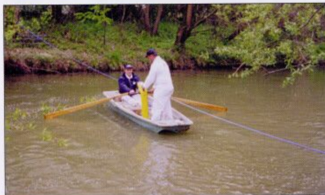
fig. 5 - Austria, aprile 1999- Attraversamento fluviale per la posa di un gasdotto (lunghezza di tiro 250 m, diametro della condotta DN 160 in PEAD): a) perforatrice da DDD a terra, stazione di partenza; b) controllo direzionale in sub alveo mediante sistema radio di tipo walk over - (per gentile concessione della SE S.r.l. - Italia)

traversare aste fluviali, piazzali ferroviari e/o aeroportuali, grandi strade e aree di svincolo stradale, con i vantaggi tipici della perforazione a secco, potendo quindi perforare anche materiali lapidei ed abbattendo nel contempo ed in misura drastica gli impatti ambientali (figg. 5 e 6).