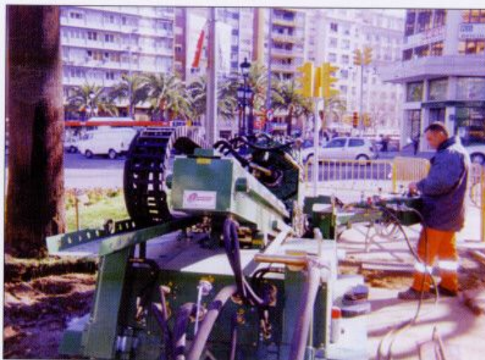
fig. 3 - Plaza Francesc Macià - Barcelona (España)- giugno 1999 - Realizzazione di un anello per reti di telecomunicazione attorno alla piazza, mediante DDD

Con la tecnologia a fanghi ed in particolare con quella a getto in pressione (taglio idromeccanico) anche la presenza di un semplice trovante roccioso può costituire un ostacolo che obbliga allo scavo di una buca per l'eliminazione, dalla superficie, dell'ostacolo stesso. Con l'uso dei mud motors il risultato decisamente migliora, anche se in presenza di ostacoli molto duri (roccia compatta, cemento armato, ecc.) è necessario ricorrere, al fine di mantenere elevate produttività, all'uso di punte speciali dal costo elevato (come ad esempio gli scalpelli di tipo PDC – Polycrystalline Diamond Compact) con un conseguente aumento del costo di produzione dell'installazione, senza di-